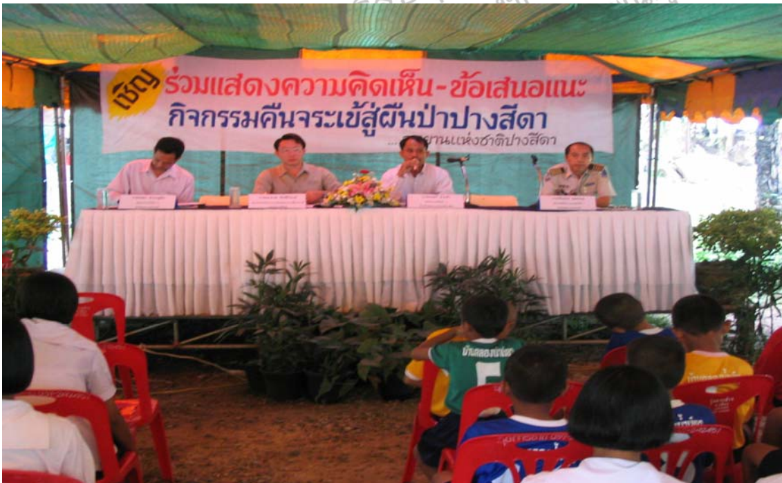
ภาพที่ 5 แสดงการมีส่วนร่วมของประชาชน

ที่มา : ฝ่ายการท่องเที่ยว อุทยานแห่งชาติปางสีดา ถ่ายเมื่อ เดือนมกราคม 2548